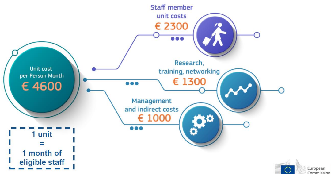
Figura 3. Contribuțiile unitare pentru MSCA Staff Exchanges 2

Indemnizația suplimentară pentru personalul detașat contribuie la costurile de călătorie, cazare și ședere aferente detașării.