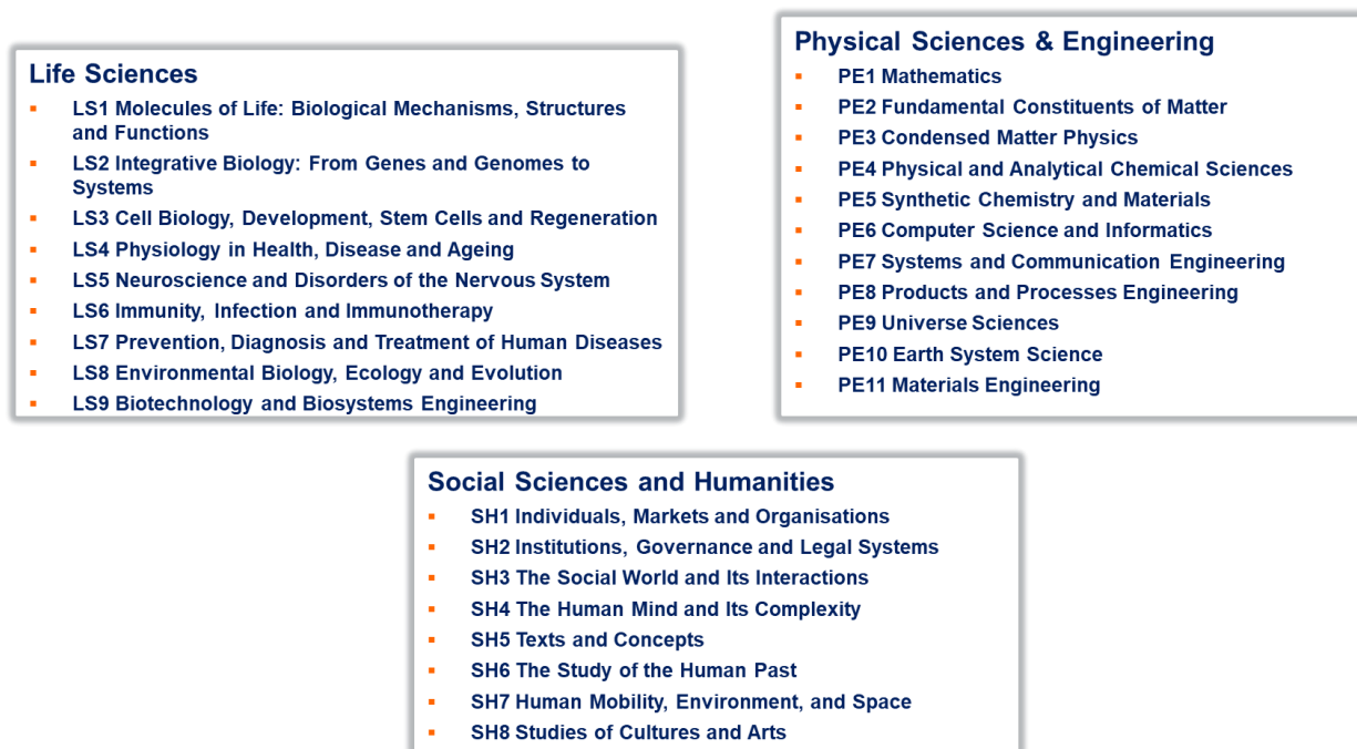
Figura 2. Paneluri de evaluare pentru proiectele ERC